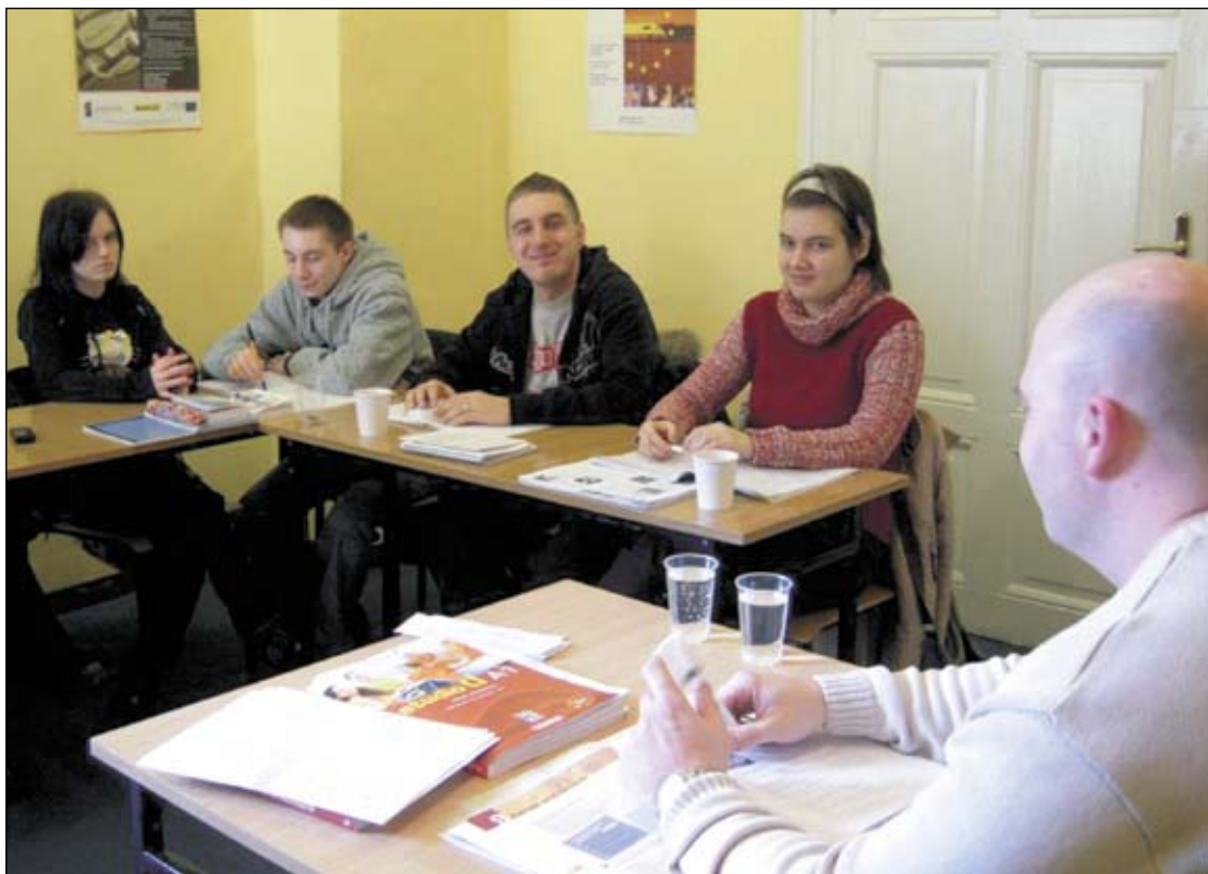
Stażyci uczestniczący w praktykach w Niemczech

Szukasz pracy w kraju, ale brakuje Ci odpowiednich kwalifikacji? Możesz je zdobyć za granicą. Powiatowy Urząd Pracy już po raz drugi organizuje praktyki dla bezrobotnych w Niemczech.